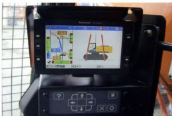
作業状況と重心位置を表示する「ハイリフトモニター」