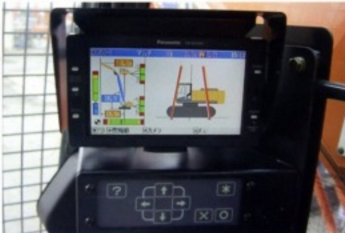
作業状況と重心位置を表示する“ハイリフトモニター”